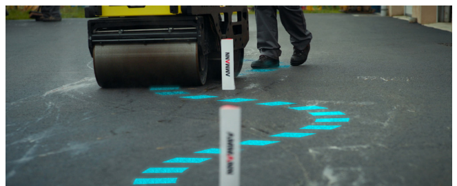
AWR 65-S Handgeführte Walze mit 15° Lenkwinkel